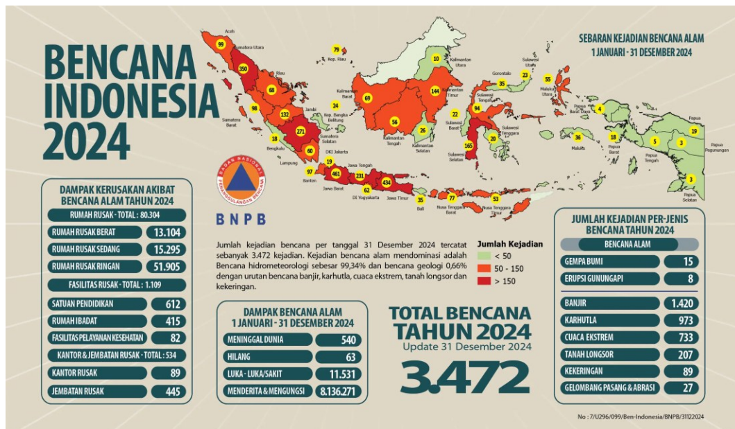
Gambar 1. Data Kejadian Bencana di Indonesia Tahun 2024

Keseluruhan kejadian bencana pada tahun 2024 mengakibatkan 540 orang meninggal, 63 orang hilang, 11.531 orang luka-luka serta membuat 8.136.271 orang menderita dan mengungsi. Selain itu, kejadian bencana pada tahun 2024 juga memberikan dampak kerugian materi berupa kerusakan pada bangunan/infrastruktur, di antaranya 80.304 unit rumah, 612 unit fasilitas pendidikan, 415 unit fasilitas peribadatan, 82 fasilitas kesehatan, 89 unit perkantoran, dan 445 Jembatan. Korban meninggal dan hilang pada tahun 2024 paling banyak diakibatkan oleh bencana banjir dan bencana tanah longsor yakni total sebanyak 470 orang dengan masing-masing kejadian bencana tersebut menyebabkan 235 korban jiwa 2 . Hal ini sebagaimana tampak pada Gambar 1. berikut ini.